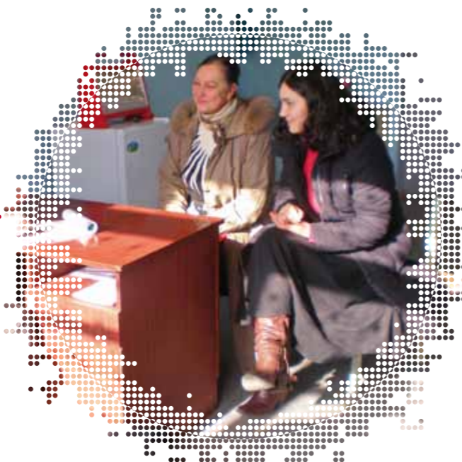
Georgische vrouwen tijdens een homeopathisch consult