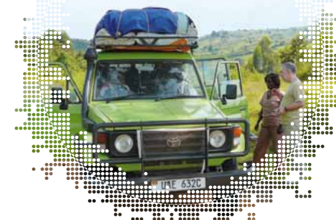
Op weg in het groene Uganda