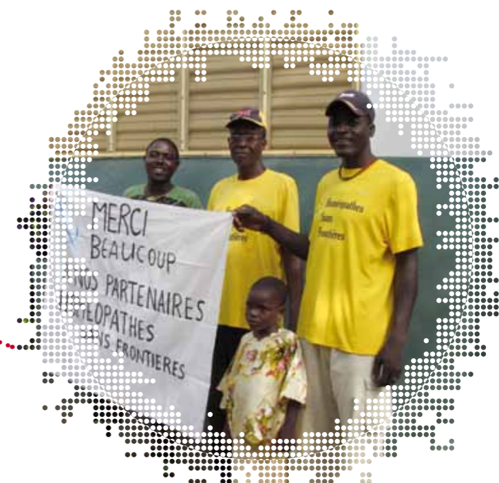
Enthousiaste cursisten in Benin